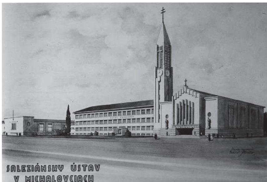
Saleziánske dielo – Michalovce.