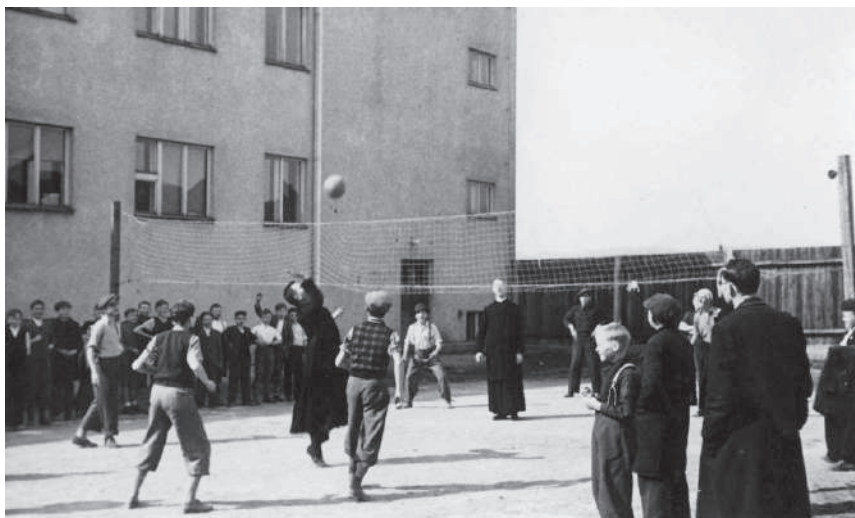
Saleziánske dielo v Žiline.