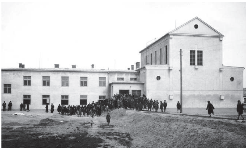
Druhý saleziánsky dom v Trnave – Kopánke.

Slovenská štátna samostatnosť v roku 1939 umožnila aj cirkevnoprávne zriadenie samostatnej Slovenskej saleziánskej inšpektórie. V Slovenskej republike saleziánske dielo dostávalo nové impulzy nielen od cirkevných, ale aj od štátnych predstaviteľov na čele s prezidentom Dr. Jozefom Tisom. Všetci si boli vedomí zvýšenej potreby dobrej výchovy slovenskej mládeže, ktorú bolo treba chrániť pred zhubnými vplyvmi Hitlerovho národnosocialistického novopohanstva, ale aj pred prenikaním zhubnej boľševickej ideológie bojovného ateizmu. Nielen že saleziánom nič neprekážalo v ich účinnom apoštoláte medzi mládežou, ale vždy na nových miestach Slovenska ľudia žiadali o ich prítomnosť. Za krátkych šesť rokov trvania slovenského štátu vznikli na Slovensku štyri nové sídla Saleziánskej spoločnosti. Príklad horlivých a odborne pripravených saleziánskych kňazov vychovávateľov tak pôsobil na mladých študentov, že každoročne pätnásť až dvadsať z nich sa uchádzalo o vstup do noviciátu Saleziánskej spoločnosti, aby sa mohli stať saleziánmi. Po krátkych dvoch desaťročiach slovenská saleziánska inšpektó-