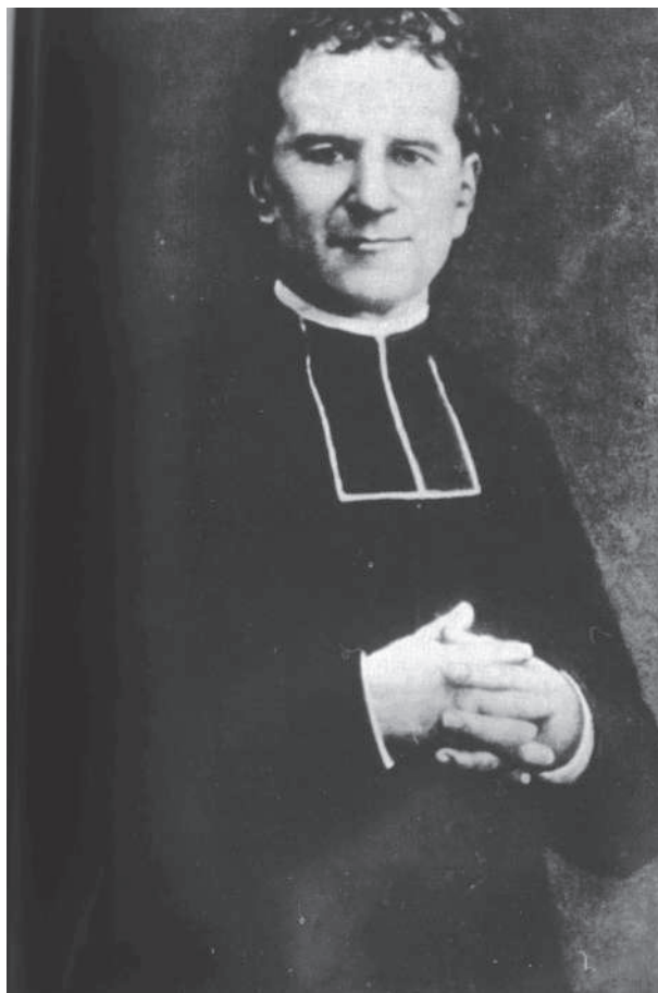
Mladý kňaz Ján Bosco (Jedna z najstarších fotografií.)

vzdelávanie v Turíne. Ten ho vypočul a jednoznačne mu radil: „Ani jedno, ani druhé. Príďte sem do Turína do nášho ústavu.“ Bol to ešte iba nie tak dávno (1818) založený ústav s názvom Collegio Ecclesiastico (Cirkevné kolégium), ktorého cieľom bolo dať mladým kňazom vyššie a hlbšie vzdelanie, aby mohli čeliť značnému chaosu, ktorý nastal v súvislosti s národnou re-