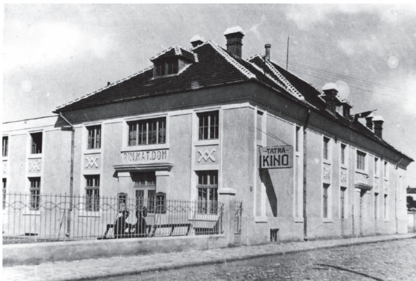
Saleziánske dielo – Topoľčany.