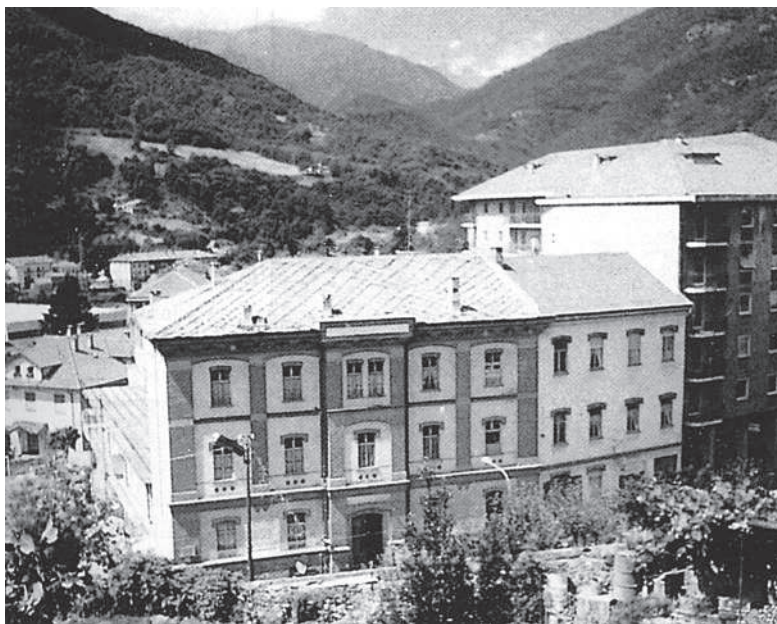
Dom pre slovenských študentov v Perose Argentine.

Zachovala sa nám iba pečať tohto prvého ústavu pre slovenských Saleziánov.