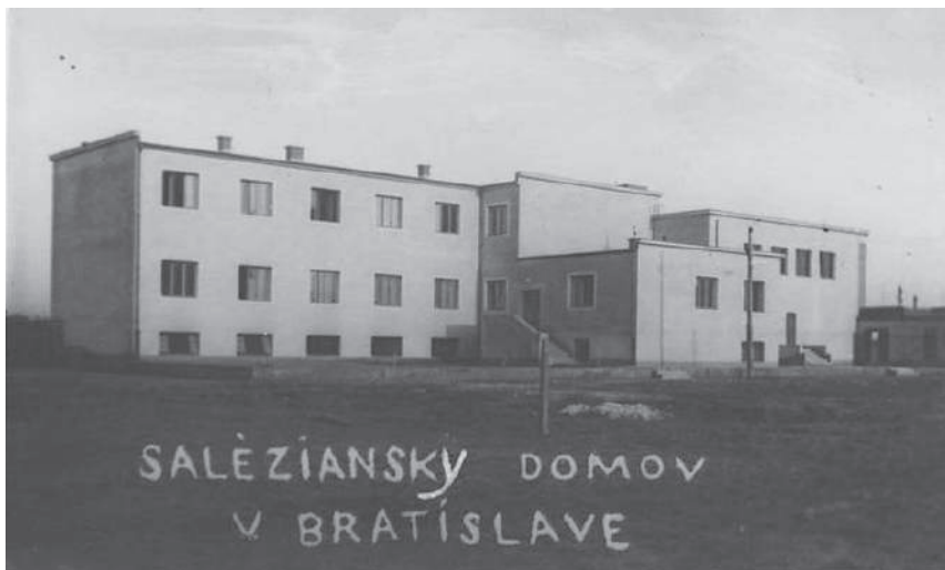
Prvý saleziánsky dom v Bratislave, Miletičova ulica.

dých ľudí priestory a láskavé vedenie saleziánov, aby sa z nich stali podľa saleziánskeho výchovného systému poctiví občania a dobrí kresťania svojej vlasti. Tento dom sa postupne stal hlavným sídlom Saleziánov na Slovensku.