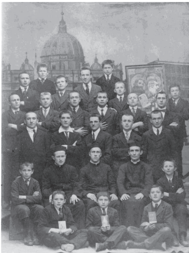
- Slovenski Salesianski študenti - na hrobo Sv. Cyrilla v Rime 1921 -