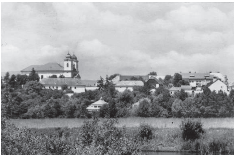
Saleziánska Vysoká škola teologická – Sv. Kríž nad Hronom.