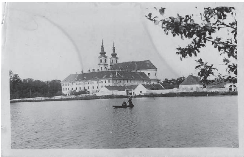
Prvý saleziánsky dom na Slovensku – Šaštín.