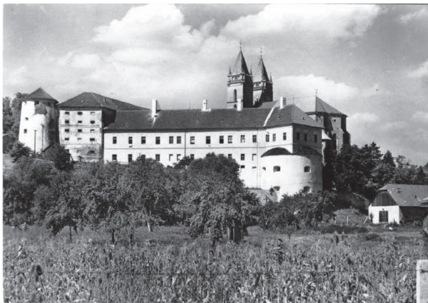
Noviciát saleziánov – Sv. Beňadik nad Hronom.